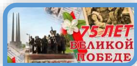
УКП при МБОУ СОШ №1 ст. Полтавская