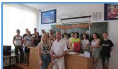
УКП при МБОУ СОШ №15 ст. Старонижестеблиевская